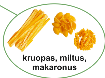
kruopas, miltus, makaronus