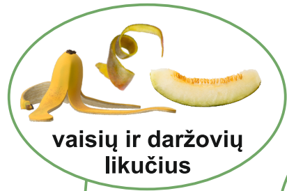
vaisių ir daržovių likučius