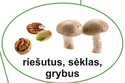
riešutus, sėklas, grybus