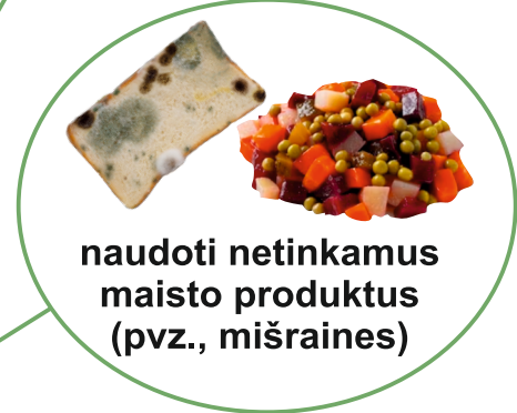
naudoti netinkamus maisto produktus (pvz., mišraines)