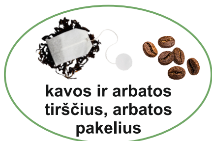
kavos ir arbatos tirščius, arbatos pakelius