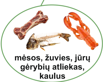
mėsos, žuvies, jūrų gėrybių atliekas, kaulus