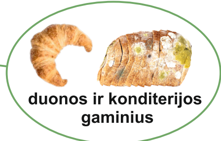
duonos ir konditerijos gaminus