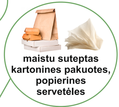
maistu suteptas kartonines pakuotes, popierines servetėles